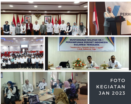
FOTO KEGIATAN JAN 2023